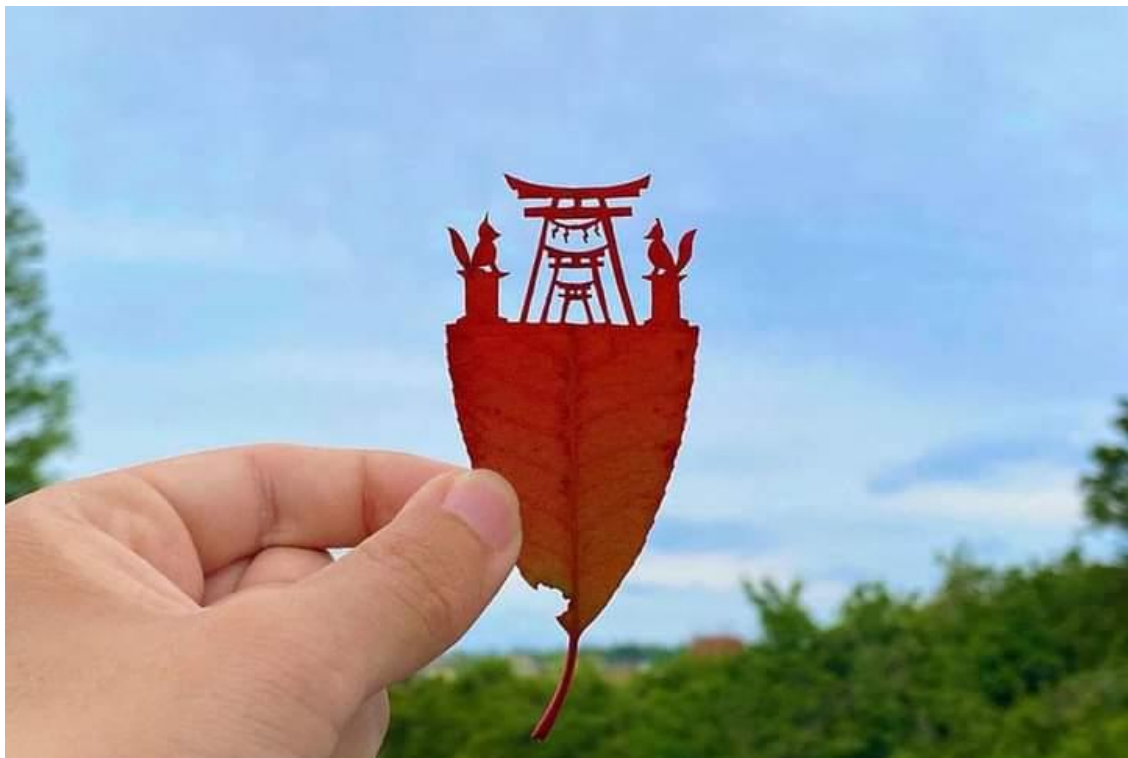
Un Sanctuaire Inari avec une Kōyō (Feuille rouge)

https://hitek.fr/42/lito-leaf-art-decoupage-feuilles-arbres-scenes_8185