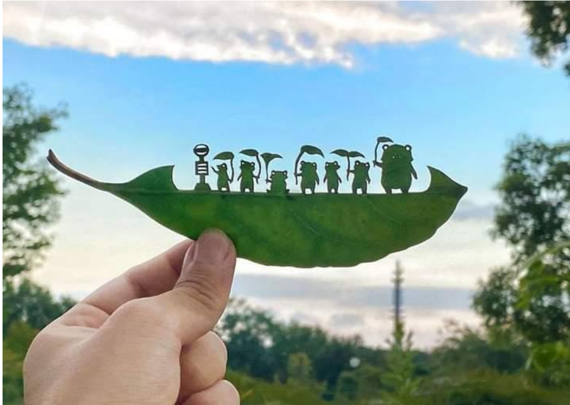
La scène de l'arrêt de bus de Totoro avec des grenouilles