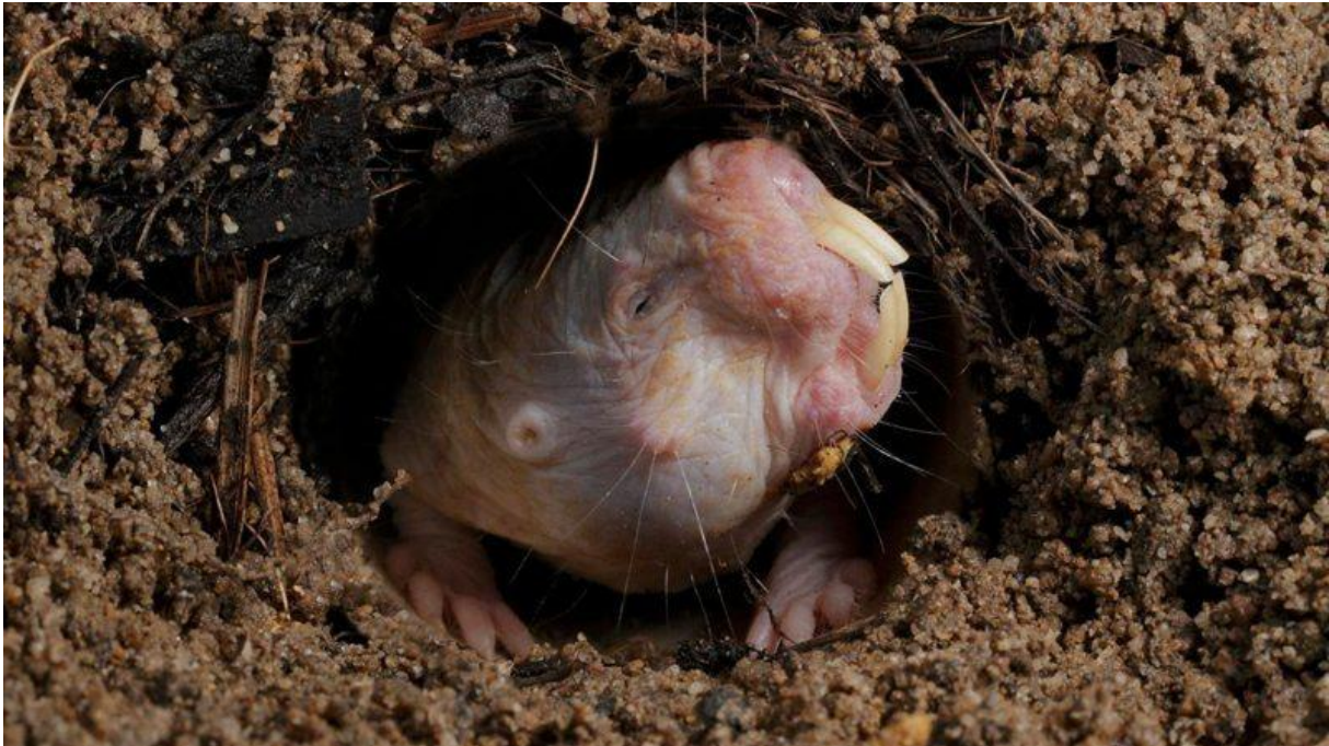
Le rat-taupe nu ( Heterocephalus glaber ), le rongeur qui ne vieillit pas !

Ce petit animal n'est pas le plus mignon qui soit mais c'est l'un des plus fascinants de la planète !